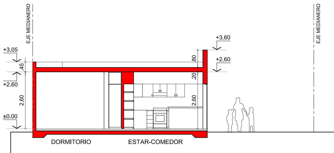
CORTE B-B / Esc. 1:100